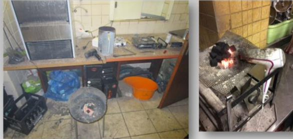
Offenes Feuer ohne Feuerstätte in einer Shisha - Bar